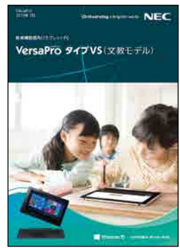
教育機関様向けタブレットPC VersaPro タイプVS (文教モデル) (2019年7月)

*：モデルによってプリインストールOSは異なりますので、詳しくはカタログをご覧ください。 また、Windows 10 Pro 64ビット (小中高等学校様向け) プリインストールモデルの ご購入は、教育委員会および小中高等学校、幼稚園に限ります。大学、専門学校、 高専、保育園等ではご購入いただけませんので、ご注意ください。