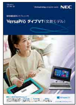
教育機関様向けタブレットPC VersaPro タイプVT (文教モデル) (2019年3月)