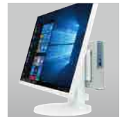
●写真はタイプMC (MC-5) の場合

*: フリーセレクションメニューの「24型/21.5型3辺狭額縁液晶」で背面装着が可能。また、別売のMultiSync® ベーシックモデルでも背面装着可能。