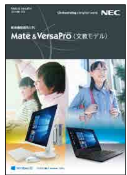
教育機関様向け Mate & VersaPro (文教モデル) (2019年7月) ※本カタログです。