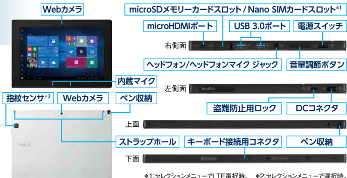
*1:セクションメニューでLTE選択時。 *2:セクションメニューで選択時。

USB 3.0ポートをはじめ、教育現場での利用を考慮した拡張ポートを装備しています。