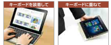
ノートPCの様に持ち運び

タブレット本体をマグネットで装着できるデタッチャブルキーボードを選択可能。デスク業務はもちろん、本体表面に装着し液晶を保護しながらノートPCのように持ち運びことや、本体をキーボードに重ねて使うことも可能です。