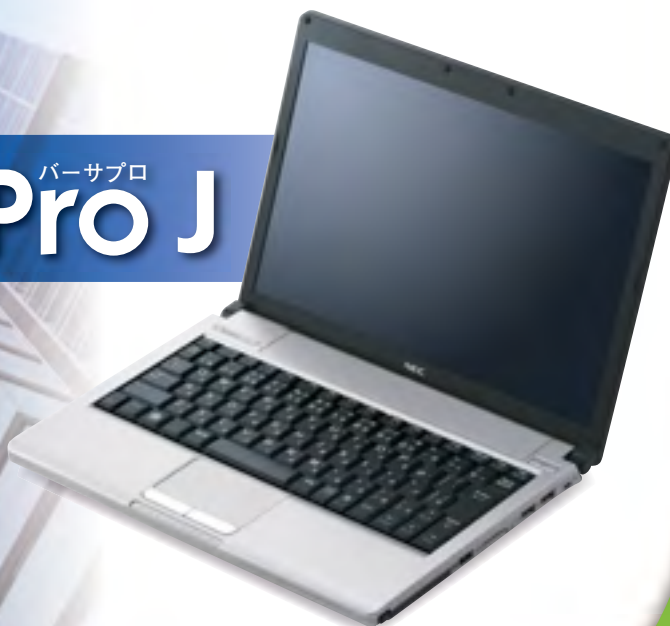
ウルトラライト UltraLite タイプVC (WXGA液晶モデル)