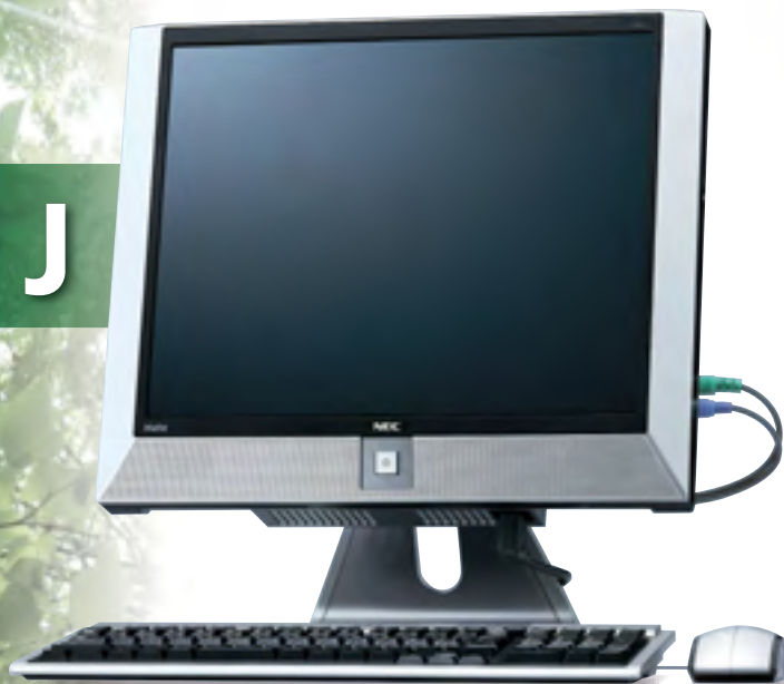
タイプMF (液晶一体型)

Windows Vista® モデル Windows XP Professional インストールサービス