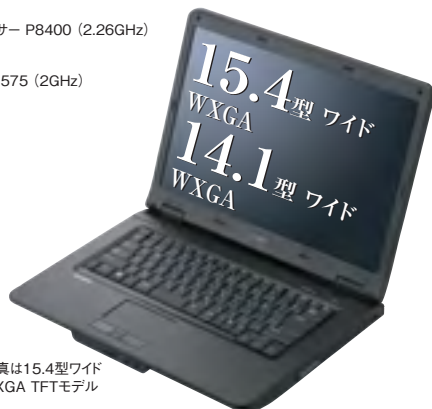
写真は15.4型ワイド WXGA TFTモデル