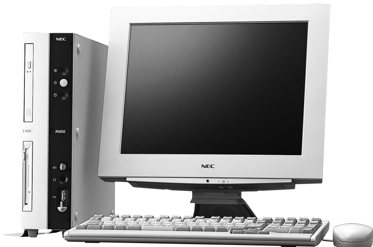
写真はMA12H/E + 15型TFTデジタル液晶ディスプレイ + テンキー付きPS/2小型キーボード。

MA12H/E インテル® Celeron® プロセッサ (1.20GHz) 標準価格 121,000円(税別)~ この標準価格は最小構成価格です。