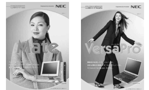
本カタログに記載されていないIOSのインストールモデルは、Mateカタログ/VersaProカタログをご覧ください。

本カタログに掲載しております全商品の価格には消費税は含まれておりません。ご購入の際、消費税が付加されますのでご承知お願います。商品の購入にあたっての配送・設置・インストール・操作指導・使用済商品の引き取り等に要する費用は、本カタログに掲載しております商品の価格には含まれておりません。詳しくは、取扱販売店にお問い合わせください。本カタログ上の価格は弊社の標準価格です。実際に関連する質問につきましては、商品をご購入された際の販売会社、またシステム構築担当者にお問い合わせください。(電話番号をよくお確かめの上おかけください) NEC 121コンタクトセンター 局番なしフリーコール:0120-977-121 受付時間...9:00~17:00(祝日を除く) 携帯電話・PHSなど、フリーコールがご利用いただけずお客様は次の電話番号へおかけください。03-3768-2337(通話料お客様負担) ご購入後の相談はお客様登録が必須となりますので、事前にお客様登録をお願いいたします。