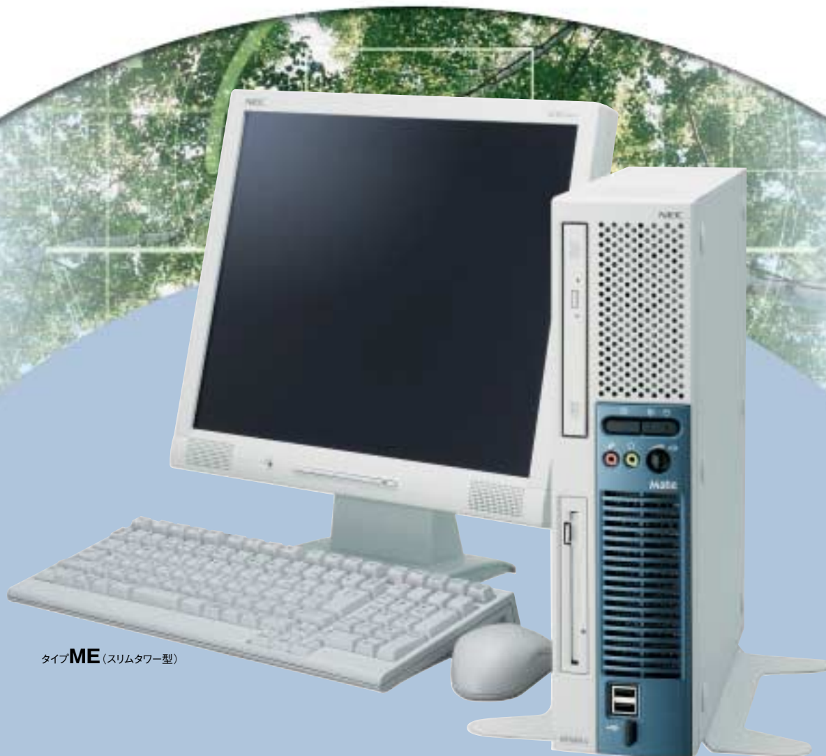
タイプ ME (スリムタワー型)

「Windows XP Professionalインストールサービス」は、 Windows Vista® Businessプリインストールモデルに 付帯するOSのダウングレード権を利用し、 Windows® XP Professionalをインストールするサービスです。