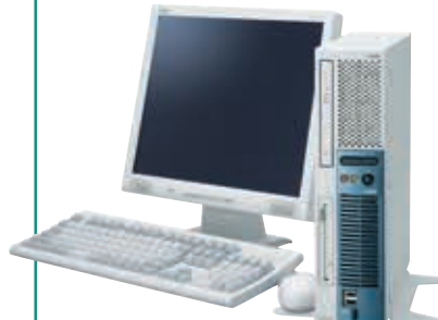
写真はMJ26A/E-2 +17型TFTアナログ液晶ディスプレイ+PS/2 109キーボード