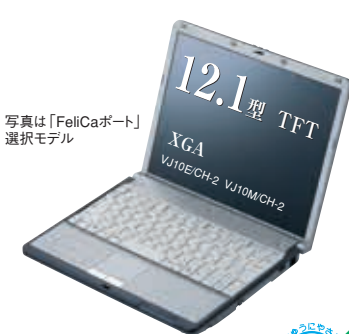
写真は「FeliCaポート」搭載モデル