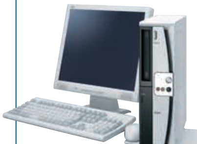
写真はMJ24A/B-2 +17型TFTアナログ液晶ディスプレイ+PS/2 109キーボード