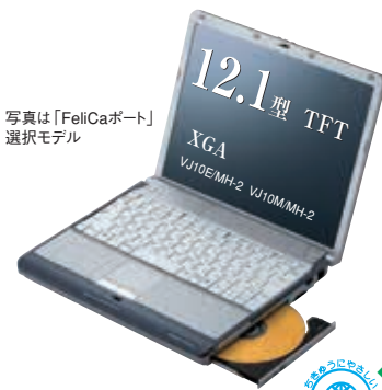
写真は「FeliCaポート」搭載モデル