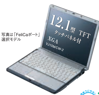
写真は「FeliCaポート」搭載モデル