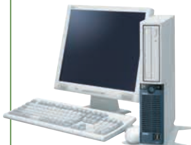
写真はMJ30V/H-2 +17型TFTアナログ液晶ディスプレイ+PS/2 109キーボード