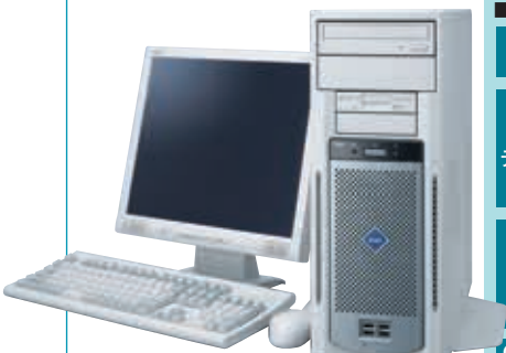
写真はMJ26A/M-2 +17型TFTアナログ液晶ディスプレイ+PS/2 109キーボード