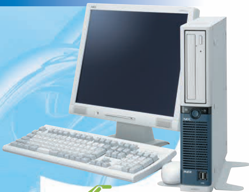
タイプMH (コンパクトタワー型)