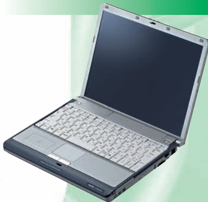
ウルトラライト UltraLite タイプVM