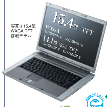
写真は15.4型 WXGA TFT 搭載モデル