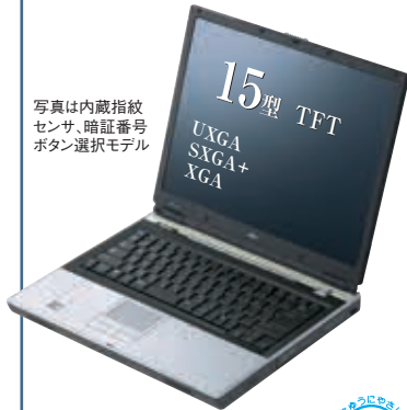
写真は内蔵指紋センサ、暗証番号ボタン搭載モデル