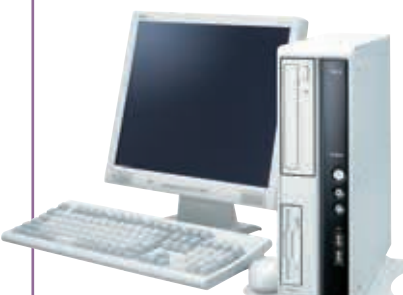
写真はMJ30V/R-2 +17型TFTアナログ液晶ディスプレイ+PS/2 109キーボード