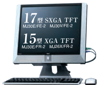
写真はMJ30E/FE-2 (17型SXGA TFT) +テンキー付きPS/2小型キーボード (黒) & 光センサーPS/2マウス