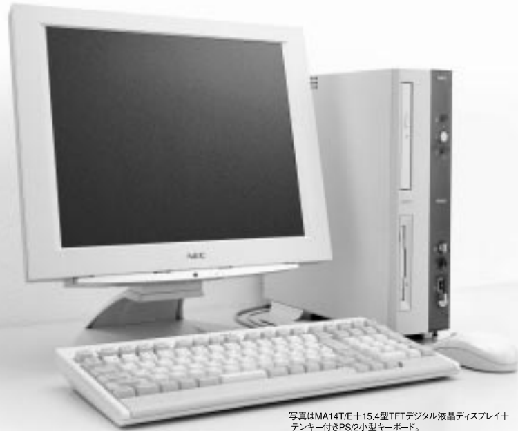
写真はMA14T/E+15.4型TFTデジタル液晶ディスプレイ+テンキー付きPS/2小型キーボード。

MA14T/E インテル® Pentium® III プロセッサ 1.40GHz 標準価格 161,000 円 (税別) ~