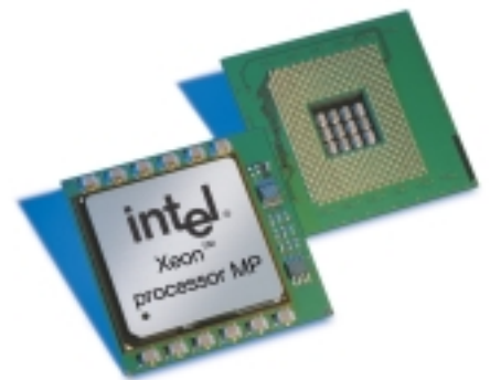
インテル社製最新CPU「Intel® Xeon™プロセッサMP」

Xeonプロセッサ搭載デュアルプロセッサ・サーバと比較した当社のテストでは、同時に処理可能なWeb要求の件数は、最大80%も増加しています。リアルタイムの株式相場システムなどでは、応答時間が最大49%高速化されました。電子メールのシステムでも、Xeonプロセッサを利用することで、サポートできるユーザ数/メールボックスの数が、最大40%増加しています。こうした実証データを有する「インテルXeonプロセッサ・ファミリ」は、インターネットビジネスにおける優位性を強化される目的に合致していることはもちろん、近い将来のサーバ・プラットフォームにも余裕を持って対応できるメリットなどを、エンタープライズ・サーバの刷新をご検討されているビジネスユーザに対して提供します。なお、当社では本年7月、インテル®Itanium®アーキテクチャを拡張した新しいICPU「インテル®Itanium®2プロセッサ」をリリースしました。ビジネスインテリジェンス/データマイニング、高い浮動小数点演算能力を生かした科学技術計算分野、広大なメモリ空間を生かした大規模データベースなどの用途に、Itaniumアーキテクチャの性能が最大限発揮されると考えます。