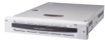
Express 5800/120Re-2 インテル®Xeon™プロセッサ (1.80GHz/2.40GHz)搭載 最大6GBメモリ 標準価格:547,000円(税別)～

Xeonプロセッサを2CPUまで搭載可能。 Webアプリケーションサーバに 最適なモデル。