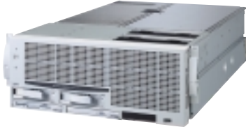
Express 5800/180Rc-4 インテル®Xeon™プロセッサMP (1.40GHz/1.60GHz)搭載 最大32GBメモリ 標準価格:3,430,000円(税別)～