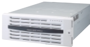
Express 5800/140Rb-4 インテル®Xeon™プロセッサMP (1.40GHz/1.50GHz/1.60GHz)搭載 最大12GBメモリ 標準価格:980,000円(税別)～

Xeonプロセッサを2CPUまで搭載可能。 Webアプリケーションサーバに 最適なモデル。